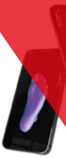
APP Flexor Scan 3D